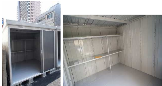
※最新の空室状況はお問い合わせくださいませ